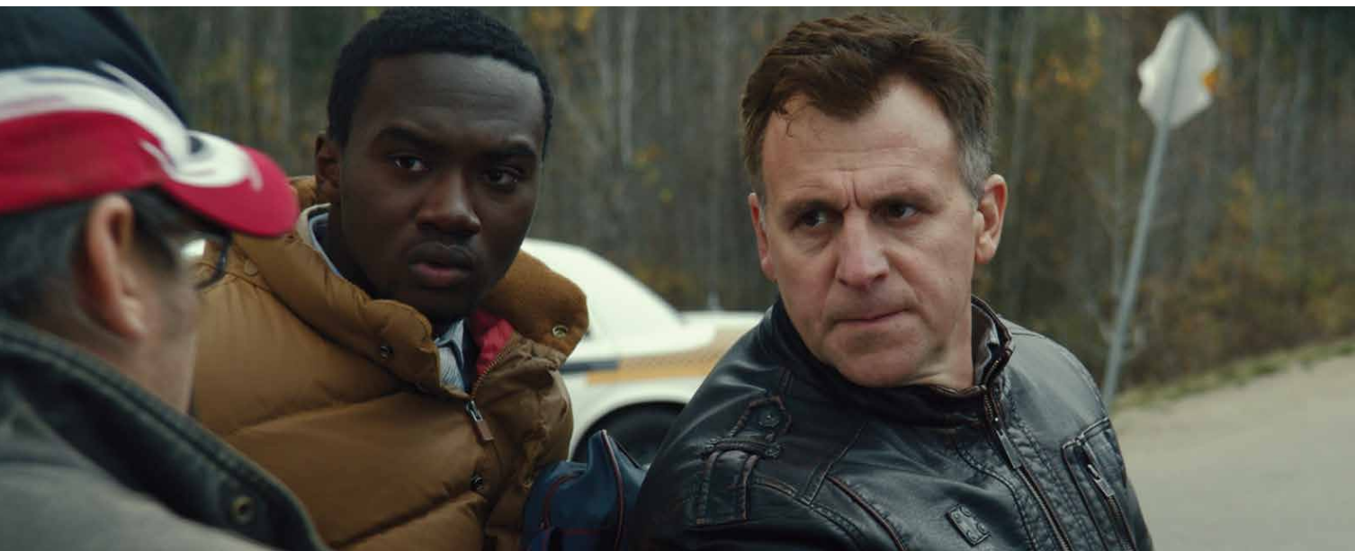
Souverain (Irdens Exantus) et Guibord (Patrick Huard) dans Guibord s'en va-t-en guerre